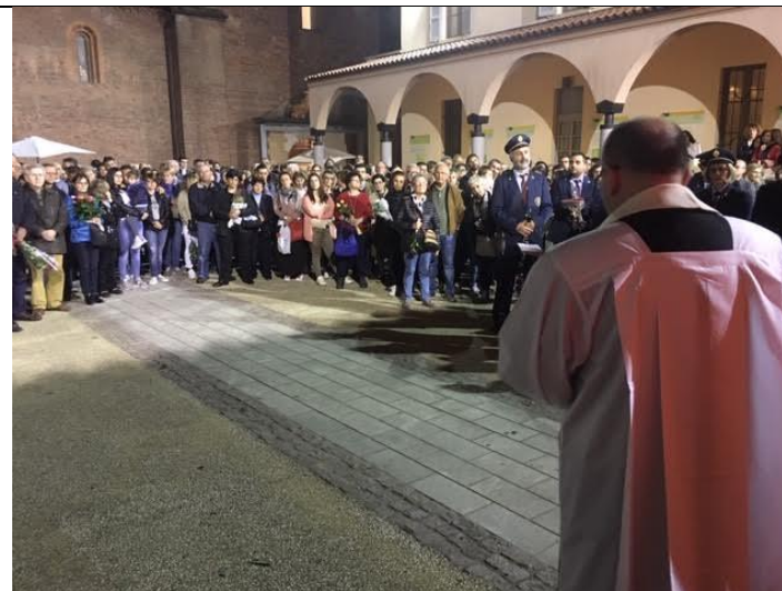
La chiusura della festa di S. Rita in Chiostro

Ogni sabato dopo la S. Messa delle 18.30: preghiera a S. Agostino e Vespri Ogni 23 del mese: preghiera a S. Severino Boezio in cripta