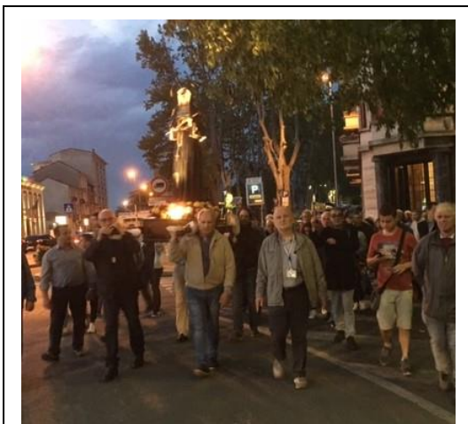
22 maggio: Processione

-L'Adorazione Eucaristica del venerdì è sospesa dopo la preghiera per i vescovi del 7 giugno.