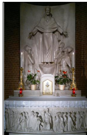
Altare del Sacro Cuore