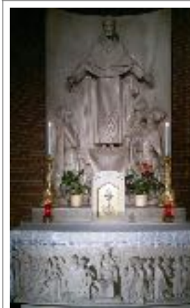
Altare del Sacro Cuore