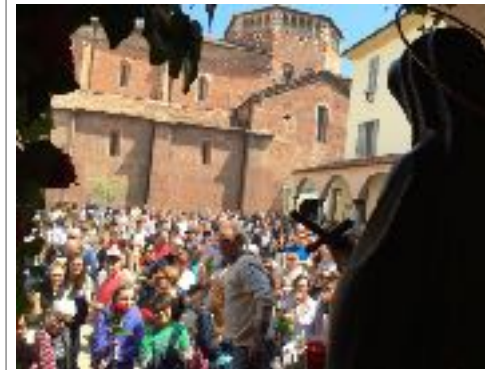
22 maggio: Supplica a S. Rita

- Domenica 10 giugno , alle ore 21.15, in Basilica, ci sarà il concerto del Coro Anchorage Concert Chorus , accompagnato dalla Orchestra Filarmonica dei Navigli di Milano.