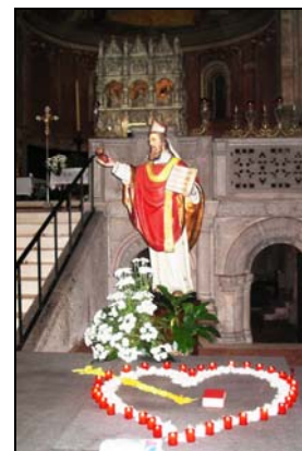
Statua di S. Agostino e Presbiterio della Basilica