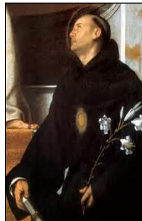
S. Nicola da Tolentino